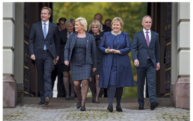
Børge Brende, Siv Jensen, Erna Solberg og Jan Tore Sanner etter regjeringsskifte i oktober.

I forkant av stortingsvalget 2013 arbeidet SLUG med å få god gjeldspolitik inn i alle partiprogrammene . Arbeidet bar definitivt frukter, og både Sosialistisk Venstreparti (SV), Kristelig Folkeparti (KrF) og Venstre hadde utfyllende politikk på gjeld i sine programmer. Særlig positivt var det at flere partier løftet frem retningslinjer for Oljefondets investeringer i statsobligasjoner som viktig, noe det ikke har vært mye debatt om siden 2010. På tross av at gjeld ikke nevnes i Høyres partiprogram, og bare så vidt skrives om i FrP