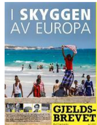
Årets første utgave av Gjeldsbrevet, som handlet om de glemte gjeldskrisene i skyggen av Europa.

SLUG ga ut to Gjeldsbrev i 2013, et i juni og et i november. Gjeldsbrevene sendes ut til omtrent 400 abonnenter, 70 organisasjoner, 30 redaksjoner og 100 videregående skoler. Gjeldsbrevet #1 kalte vi ”I skyggen av Europa” og det tok for seg gjeldskrisen som er på vei til å utvikle seg i Sør som en følge av finanskrisen og gjeldskrisen i Europa. Gjeldsbrev #2 kalte vi ”Arven etter de rødgrønne – og de blåblås ansvar” der vi gikk igjennom de gjeldspolitiske seirene de siste 8 årene og la frem noen utfordringer for den nye regjeringen. Alle tidligere Gjeldsbrev kan lastes ned på www.slettgjelda.no/ressurser .