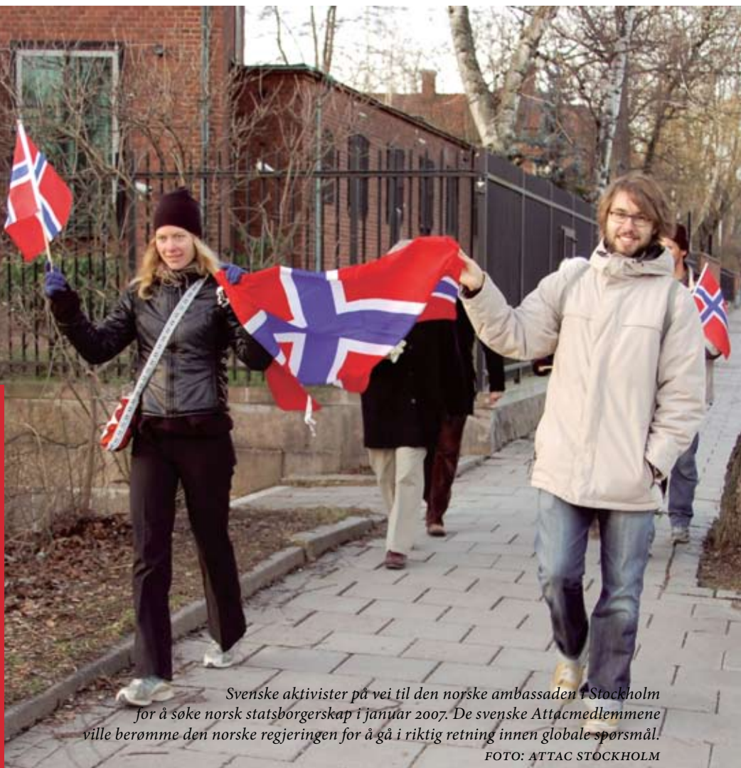
Svenske aktivister på vei til den norske ambassaden i Stockholm for å søke norsk statsborgerskap i januar 2007. De svenske Attac-medlemmene ville berømme den norske regjeringen for å gå i riktig retning innen globale spørsmål.

Export credit agencies (ECAs) er (oftest) statlige drevne institutter som skal gjøre det lettere for private investorer å investere i risikofylte prosjekter i utlandet, ved å stille med en forsikring. Det innebærer at hvis investoren ikke får den avtalte betalingen av handelspartneren vil eksportkredittbyrået overta som kreditor. Hvis det er en handelspartner i privat sektor vil det ofte stilles krav om en "motavtale" av den andre parten i handelen, slik at myndighetene i landet tar på seg betalingsansvar hvis selskapet ikke skulle innfri avtalen. På den måten blir altså gjeld mellom to private aktører til en sak mellom to stater.