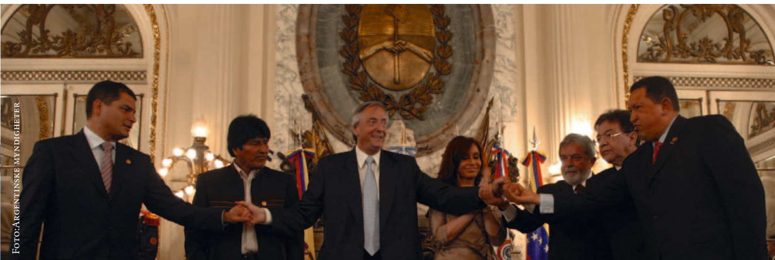
Bilde av latinamerikanske presidenter som signerer en avtale om Sørbanken noen år tilbake, blant annet Ecuadors Correa, Bolivias Morales, Brasils Lula da Silva og Venezuelas Chavez.