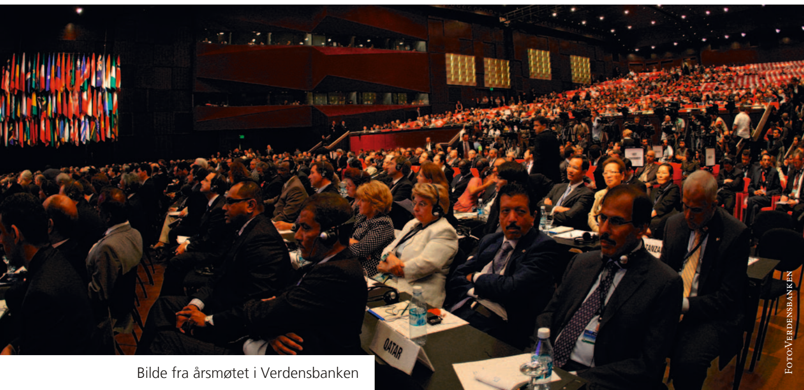
Bilde fra årsmøtet i Verdensbanken

– Norge har mye innflytelse i Verdensbanken. Vi er nok det landet som har mest innflytelse per capita. Alle de tingene vi går inn for blir Verdensbank-politikk.