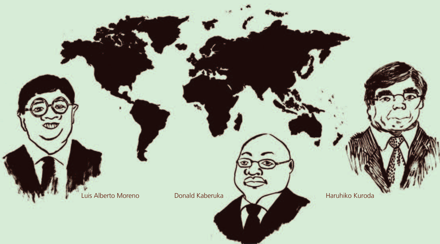
Luis Alberto Moreno