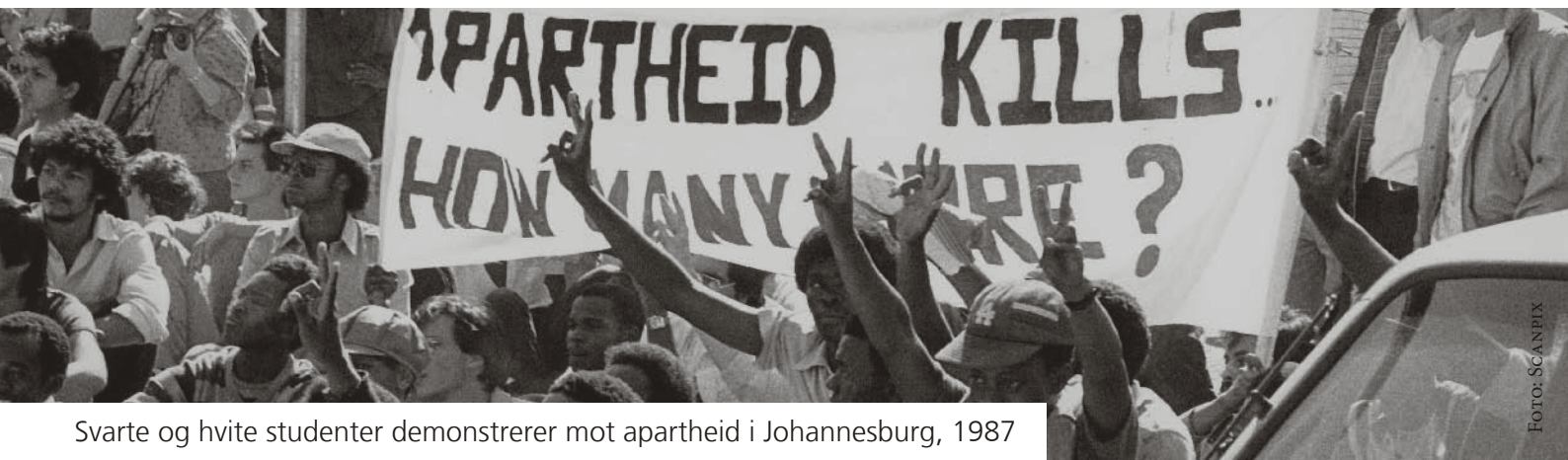
Svarte og hvite studenter demonstrerer mot apartheid i Johannesburg, 1987

Se www.khulumani.net for mer informasjon om Khulumani og deres søksmål.