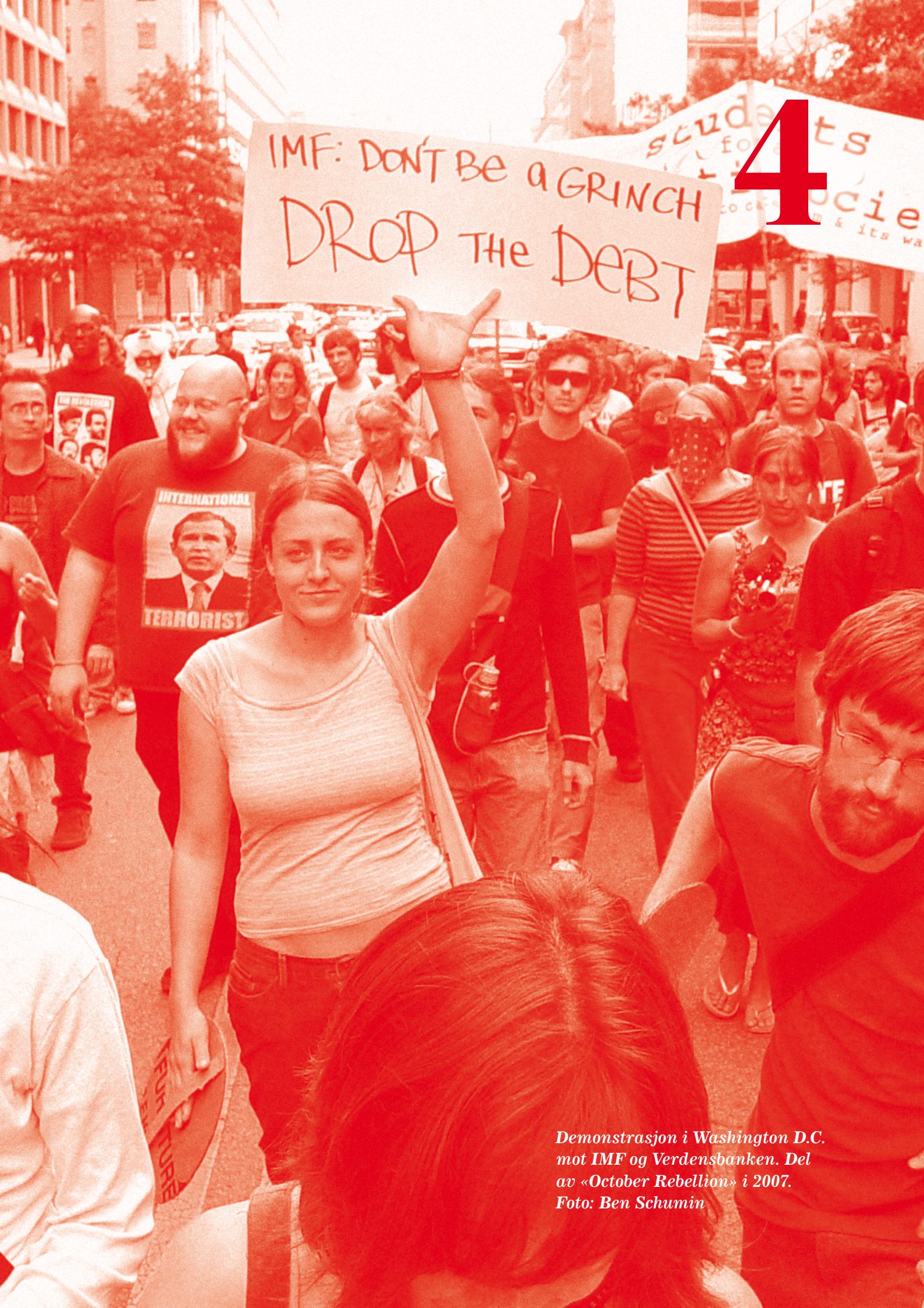
Demonstrasjon i Washington D.C. mot IMF og Verdensbanken. Del av «October Rebellion» i 2007.