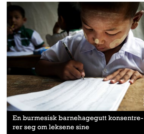
En burmesisk barnehagegutt konsentrerer seg om leksene sine