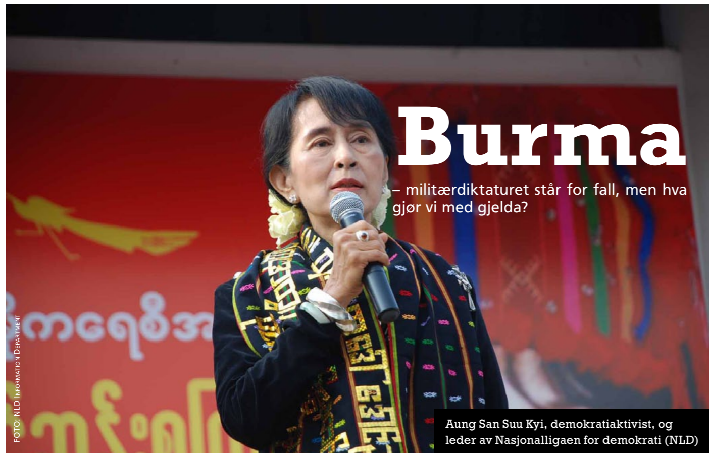
Aung San Suu Kyi, demokratiaktivist, og leder av Nasjonalligaen for demokrati (NLD)