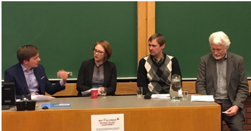
Panel samtale om Kina, det eneste fysiske arrangementet i 2020.