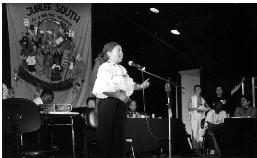
Bianca fra Conaie fra Ecuador legger vitner under tribunalen i Porto Alegre.

Vi vet ganske mye om Norges rolle i dette aktuelle tilfellet, mens det er uklart hva som har skjedd på ecuadoriansk side. 100 prosent av fordringene stammer fra Skipseksportkampanjen på 70-tallet, og nærmere bestemt fra salget av fire kjøleskip for last av bananer. Det finnes tall som viser at Ecuador har betalt store deler av det opprinnelige beløpet allerede, og det kommer stadig nye tall som viser at gjelda øker, og fortsatt er høyere en summen på lånet som ble gitt. Norge fulgte ikke egne saksbehandlingsregler, noe som gjelder en stor del av fordringene fra Skipseksportkampanjen. Det man vet lite om er