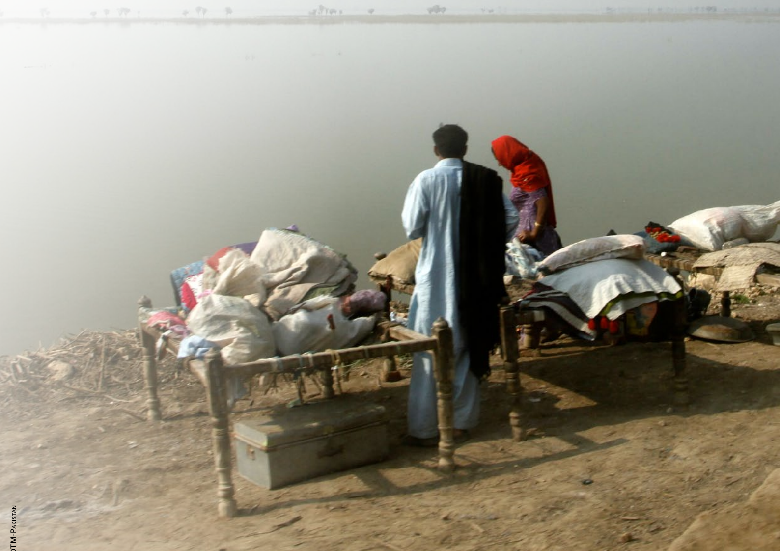
En familie vender tilbake til en fortsatt oversvømt landsby etter flommen i Pakistan, 2010

Kravet om en gjeldsrevisjon får økende støtte. Organisasjoner som CADTM-Pakistan og medlemmer av PDCC mobiliserer for å få på plass en gjeldsrevisjon kombinert med suspensjon av gjeldsnedbetaling. Målet med revisjonen er å identifisere den ulovlige, illegitime og odiose delen av Pakistans gjeld. Dette kan by på en mulig langsiktig løsning for Pakistan og gjeldsproblemene.