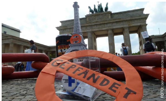
Fra Eurodad-demonstrasjon i Paris