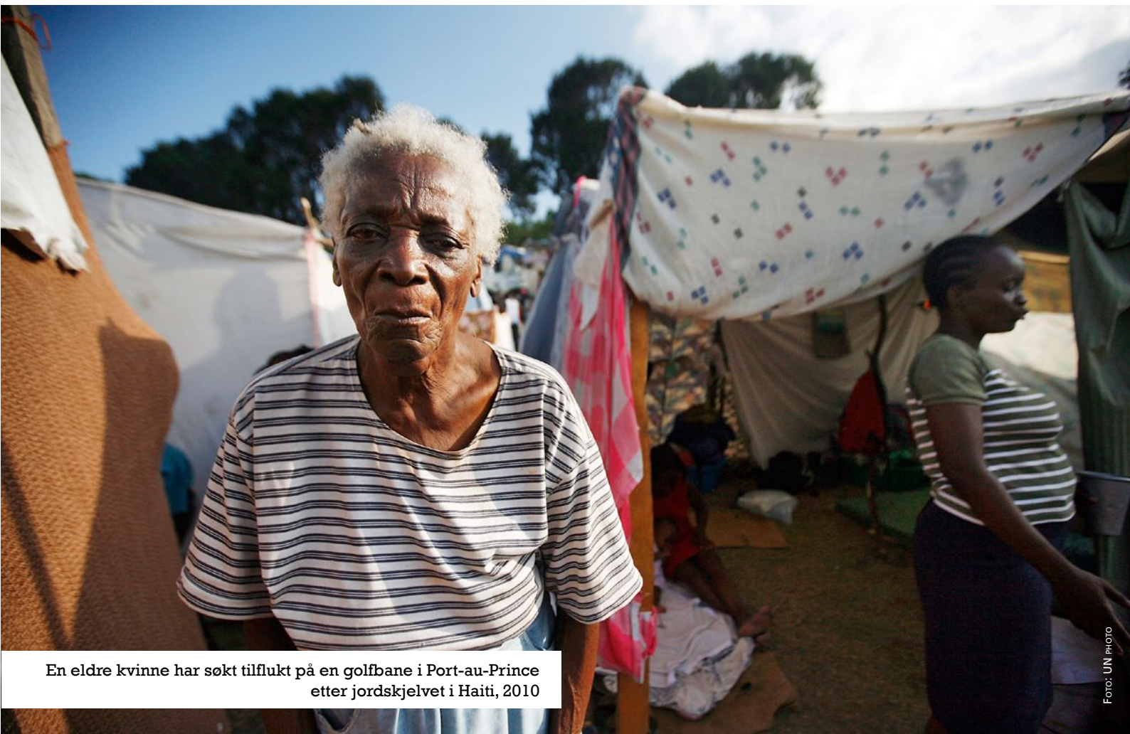
En eldre kvinne har søkt tilflukt på en golfbane i Port-au-Prince etter jordskjelvet i Haiti, 2010

Samtlige av løsningene som UNDP foreslår er avhengig av godvilje fra kreditorer og krever en større bevissthet rundt de spesielle utfordringene som de små øystatene står overfor.