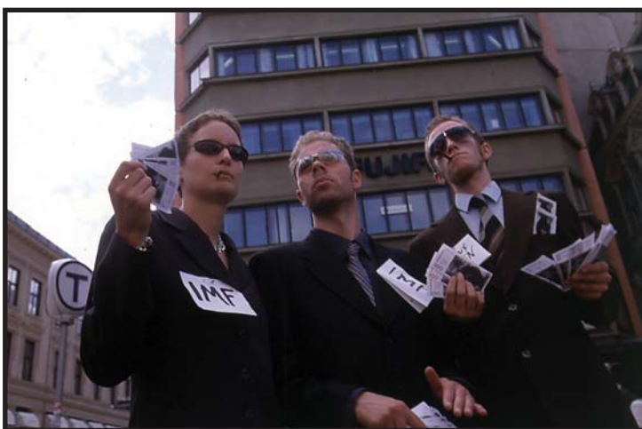
"WE HAVE WAYS TO MAKE YOU PAY": Sikkert som banken er at det er IMF som sørger for å få tilbake pengene sine.