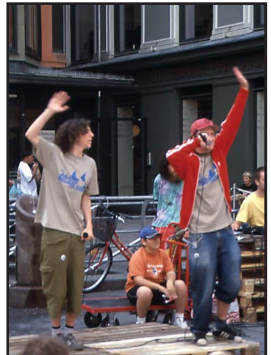
HOLD SMELLA, SLETT GJELDA: Det ropes høyt om at gjelda nå må fjernes.

Du kan lese mer om kampanjen på www.changemaker.no .