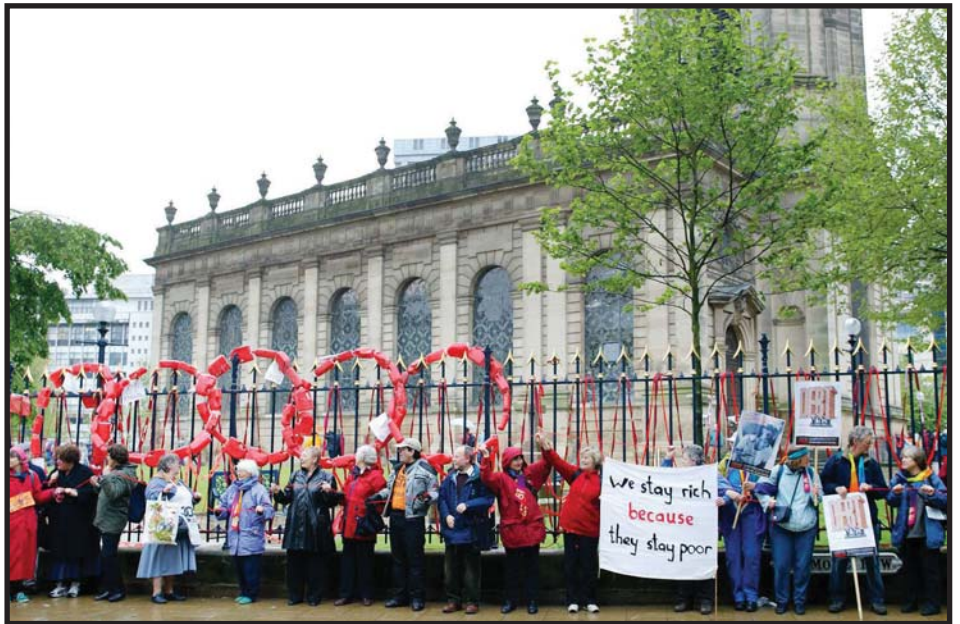
16.mai 2003: Gjeldsaktivister samles nok en gang i Birmingham for å lansere Verdens Gjeldsdag. Den 16.mai hvert år skal det markeres at gjeldskrisa ennå ikke er løst.

bukt med den skjeve maktfordelinga mellom kreditor og debitor. Dagens ordning for å forhandle om gjeldslette preges av rike lands interesser, og betjening av gjeld går på bekostning av penger til skole, mat og helse.