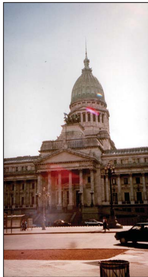
Kongressbygningen i Buenos Aires.

SLUG mener at det bør opprettes en åpen, uavhengig og internasjonal gjeldsforhandlingsmekanisme/gjeldsdomstol, som skal mekle mellom land som har havnet i en gjeldskrise og dets kreditorer. 1 Forslaget bygger blant annet på amerikansk konkurslovgivning knyttet til situasjoner der f.eks. kommuner "går konkurs". 2 Målet med en slik forhandlingsprosess er todelt. For det første kan en slik gjeldsdomstol sette en strek over det vi kaller illegitim gjeld. Illegitim gjeld er gjeld som av ulike grunner må betraktes som ulovlig (i følge vanlige nasjonale lover), umoralsk, ugyldig eller urettferdig. Gjeld som er illegitim skal ikke slettes fordi landet ikke klarer å betjene lånet, men fordi den ikke skal betales. For det andre er målet med en slik uavhengig meklingsprosess at det gjeldstyngede landet skal få en helhetlig gjennomgang av gjeldsproblemet og en bærekraftig gjeldsbyrde. I noen tilfeller vil kanskje gjennomgangen av gjeldens legitimitet innebære en så omfattende gjeldsslette, at ytterligere gjeldsslette for å bringe gjelda ned på et bærekraftig nivå ikke er nødvendig. Men i de tilfellene der ytterligere gjeldsslette er nødvendig, er det viktig at samtlige kreditorer tar sin andel av byrden gjeldssletten inne-