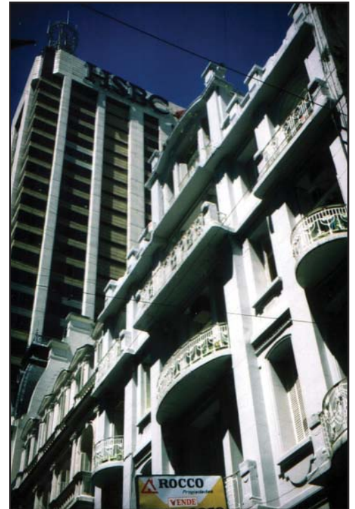
Bankene i centrum av Buenos Aires står støtt selv om landets økonomi falt.

Etter 1955 har de argentinske styresmakter vekslet mellom militærregimer og folkevalgte representanter. Til tross for at peronistpartiet ble forbudt i perioden 1955-73 klarte Perón å komme til makten igjen, ved demokratisk valg, i 1973. Da Perón døde i 1974, tok