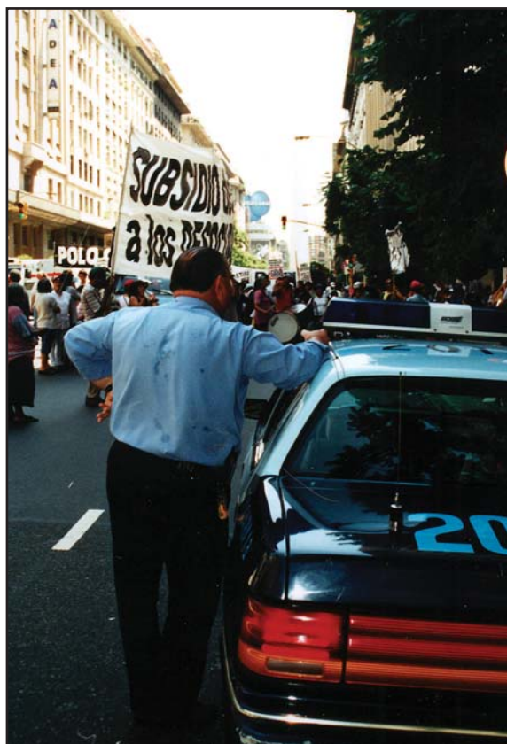
Demonstrasjoner under urolighetene i Argentina i vinter.

Det som foregår i Argentina for tiden er nytt i den nyere politiske historie. Samtidig med den øko-