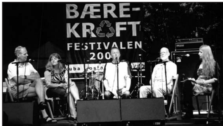
Debatt under Bærekraftfestivalen i Sommer.