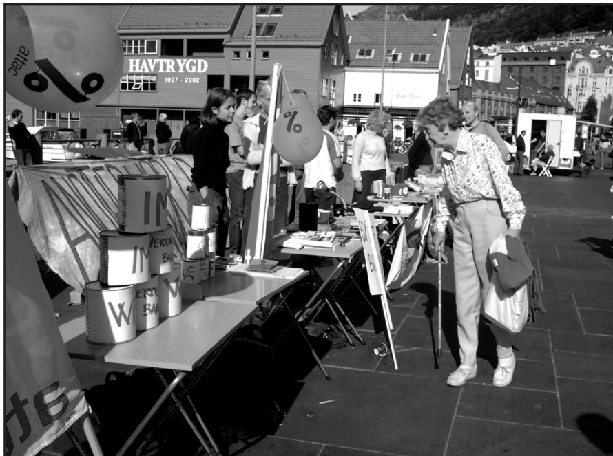
Økologisk mat og uortodoks boksekasting på bærekraftig torg i Bergen.