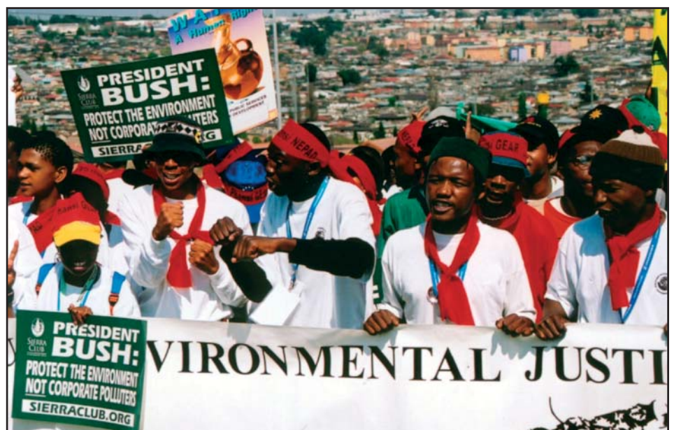
Sør-Afrikanske NEPAD-demonstranter i bydelen Alexandria under Verdenstoppmøtet i Johannesburg.

Ved FNs konferanse om finansiering av utvikling i Mexico tidligere i år, lovt amerikanske myndigheter og øke den amerikanske bistanden med ca 5 milliarder dollar. Dette klarte man etter stort press fra land i både Nord og Sør å få med i den endelige avtalen –til tross for at USA gikk i mot det. Det er positivt at USA har lovet økt bistand og at dette kommer fram i handlingsplanen. Men beløpet er så altfor lite. Økningen vil bringe amerikansk bistand opp fra lave 0,1 til 0,12 prosent av BNI, og er ikke et tilstrekkelig bidrag for å kunne sette handlingsplanen ut i livet. Dessuten har amerikanerne satt en rekke politiske betingelser for bistanden, betingelser som kan innebære at økningen på 5 milliarder per år aldri blir utbetalt.