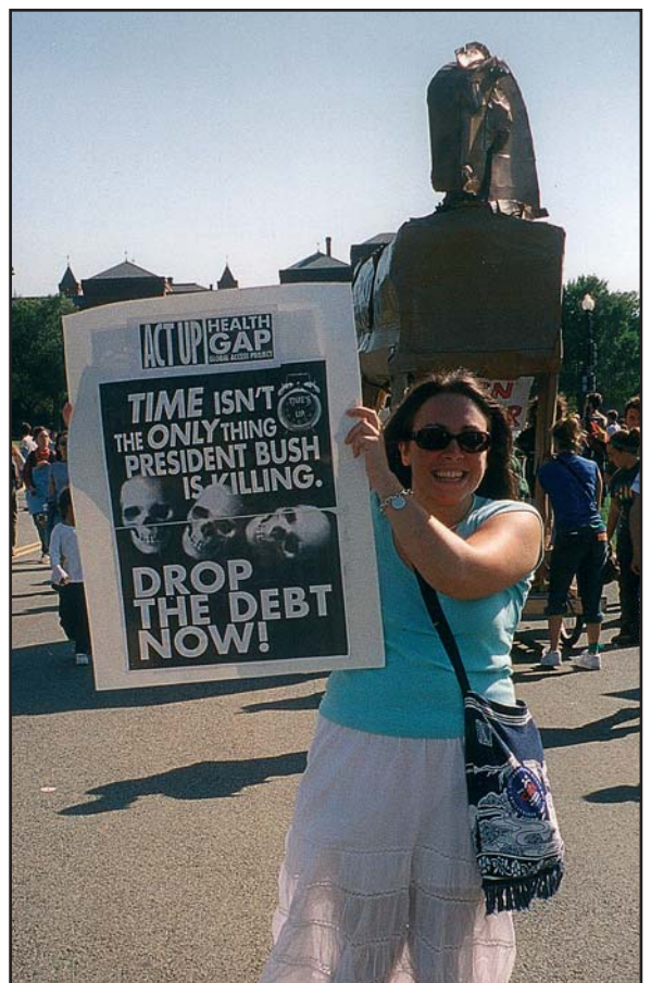
Fra demonstrasjonene under Verdensbankens og IMF's årsmøter.

Jovisst er det fint å treffe folk fra Sør som har opplevd historiene på kroppen og jovisst er det fint å oppleve at vi har noe til felles til tross for adskilte erfaringer, og oppleve at vi har et globalt nettverk og