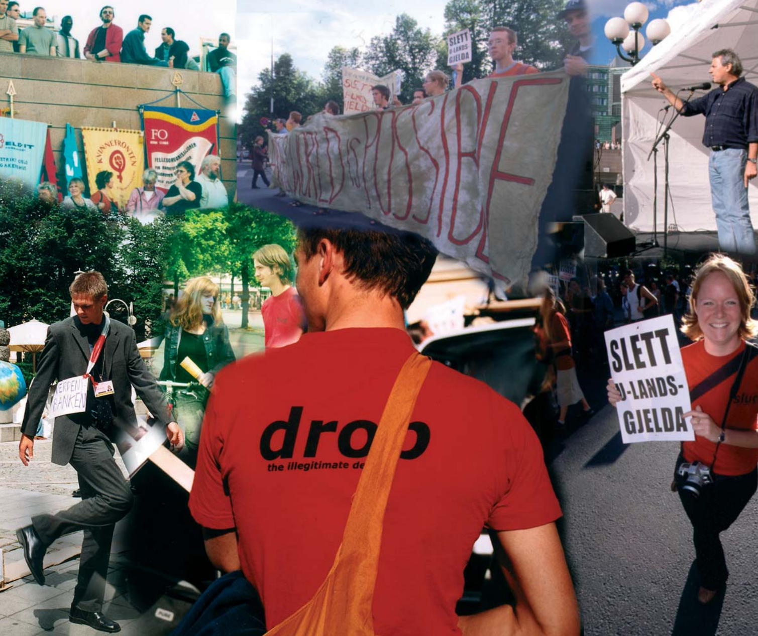
Store demonstrasjoner under Verdensbankens ABCDE-konferanse i Oslo i sommer.